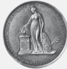
Medaille auf die Aufhebung der Leibeigenschaft im Herzogtum Nassau, um 1812