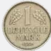
Bundesrepublik Deutschland Eine D-Mark, 1950