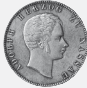
Herzog Adolph von Nassau Zwei Thaler, um 1844