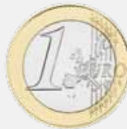
Deutschland Ein Euro, seit 2002